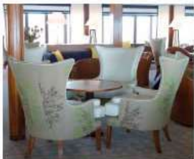
Sirocco / Pont Principal