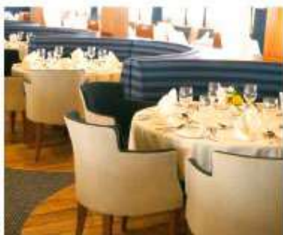
Restaurant / Pont A