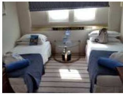
Cabine double avec sabords