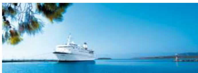
Les escales et visites prévues dépendent des conditions météorologiques et de navigation

8h Le Ms Berlin accoste dans le port de Nice. Après le petit déjeuner, débarquement au port.