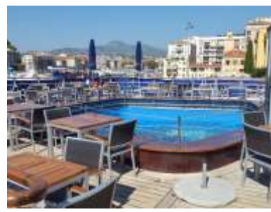
La piscine et sa terrasse

Les cabines sont toutes équipées de climatisation individuelle, écran plat avec lecteur DVD, sèche-cheveux, Minibar.