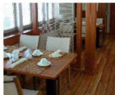
Restaurant le Veranda / Pont Promenade

Le MS Berlin vous offre une table raffinée avec de savoureux menus pour le plaisir des palais gourmands, dans le cadre lumineux de ses deux restaurants donnant sur la mer. Cinq repas sont servis chaque jour incluant les boissons : vin de table rouge, blanc et eau minérale, café ou thé. Une carte des vins (payants en supplément) est également disponible. Pour le déjeuner et le dîner vous avez le choix : à la table au restaurant principal situé au Pont A ou sous la forme d'un buffet à la Véranda situé au pont promenade. Tous les soirs après le spectacle retrouvez également un buffet de minuit sous forme de mignardises sucrées.