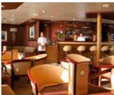
Yacht Club / Pont Promenade