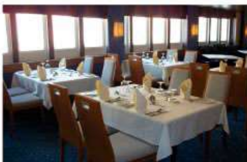
Restaurant / Pont A