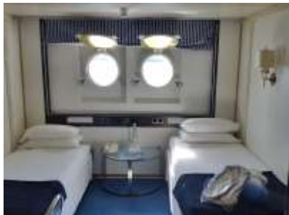
Cabine double avec hublots

Catégorie 5 : Cabines doubles extérieures avec sabords situées au Pont Principal = 2 105 €