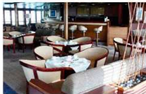
Yacht Club / Pont Promenade

Les salons du navire sont disponibles sur les Ponts Promenade et Principal. Ils bénéficient d'une superbe luminosité car tous les deux donnent sur la mer avec de grandes baies vitrées. Les salons Sirocco et Yacht Club ont chacun un bar où vous seront proposées les cocktails du jour et autres boissons. Les boissons au bar ne sont pas incluses, les consommations à bord sont ajoutées sur votre compte de croisière à régler en fin de séjour. Vous avez la possibilité de souscrire un forfait boisson au moment de la réservation (renseignement à l'UNIA). A titre indicatif (tarif 2016) un expresso : 2,10 €, un thé 2,20 €, 1 litre eau minérale 2,70 €, une bière pression 33cl 3,40 €, un jus de fruit 2,90 €.