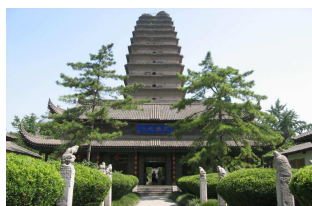
Pagode de l'Oie Sauvage

Solde 1 770 € au plus tard le 15/06/2018