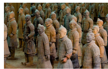
Xi'An. Armée de terre cuite