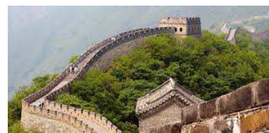
La Grande Muraille