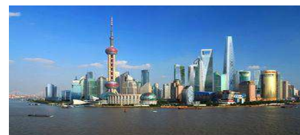
Shanghai - Le Bund