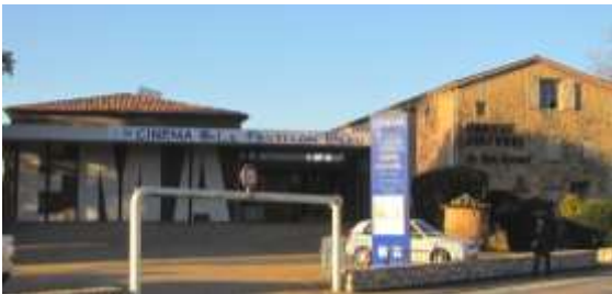
Le cinéma Le pavillon bleu à Roquefort-les-Pins