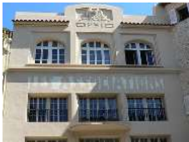
La Maison des Associations à Antibes