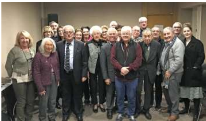
Le Conseil d'Administration de la nouvelle mandature

Le nouveau Conseil d'Administration a tenu sa première réunion le jeudi 31 janvier 2019. La composition du nouveau Bureau y a été confirmée comme sur les bulletins de vote.