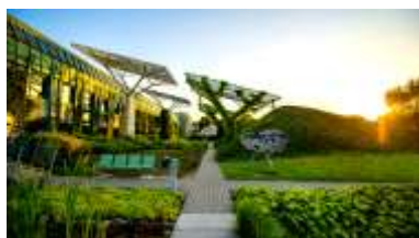
Jardins suspendus de la Bibliothèque Nationale

Vous partirez ensuite pour une visite panoramique en autocar pour prendre connaissance avec les monuments principaux de la ville. Vous terminerez la journée par une promenade à pied dans le grand Parc Lazienki dessiné au XVII e de style baroque et la découverte des jardins suspendus de la Bibliothèque Nationale de Varsovie et son point de vue sur la capitale polonaise. Dîner et nuit à l'hôtel.