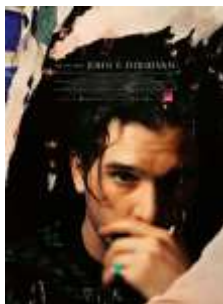
Ma vie avec John F. Donovan