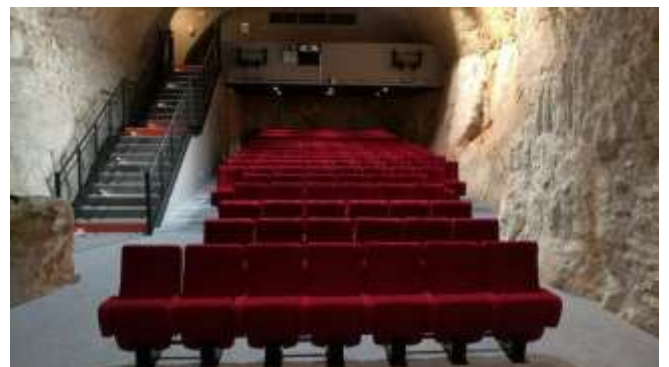
L'auditorium de la Citadelle de Villefranche-sur-Mer

Tél. : 06 11 60 74 72 ou au 04 93 76 33 33 (Hôtel de Ville), de préférence de 10h à 12h . mfuvia@free.fr .