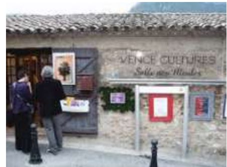
La salle des Meules à Vence

L'Oiseau Lyre - www.oiseau-lyre.fr oiseau-lyre.vence@bbox.fr