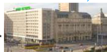
Hôtel Metropol 3*

5 rue Verdi, 06000 Nice tél : 04 93 13 46 62